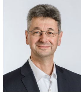
Prof. Dr. Michael Piazolo

Moderne Technik ist ein Schlüssel zur Bewältigung globaler Herausforderungen und zur Sicherung von Fortschritt und Gemeinwohl. Der Technologiestandort Bayern leistet hier einen starken Beitrag. Um diesen Beitrag auszubauen, ist die Förderung des MINT-Nachwuchses an unseren Schulen eine wichtige Aufgabe. Das gelingt uns durch eine enge Verbindung von Schule und Wissenschaft und speziell mit hervorragend ausgebildeten Lehrkräften, die mit Leidenschaft unterrichten, Neugierde wecken und Begabungen begleiten.