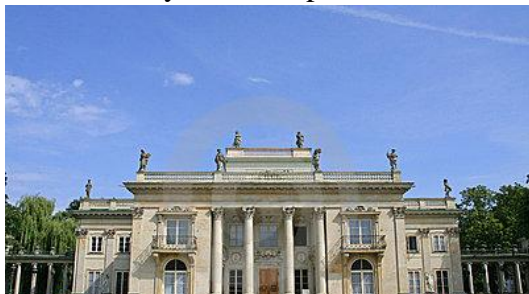
Łazienki Palast im Łazienki Park