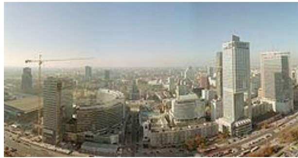
Panorama vom Kulturpalast 1

zum Thema „Primordiale Narrationen“ ging. Als direkt vergleichende Größe im diesem Kontext fungierten die Studenten aus Regensburg, die aktiv in die Diskussionen einbezogen und nach ihrer Meinung, sowie nach ihren narrativen, kulturellen Prägungen gefragt wurden. Nach diesem lebhaften