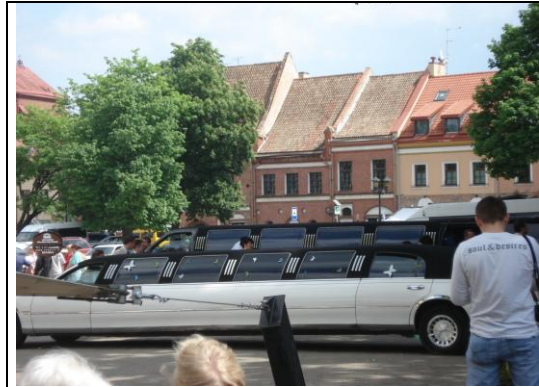
Hochzeitslimousinen auf dem Marktplatz in Kaunas

Über das Wochenende mieteten wir uns ein Auto um nicht nur Vilnius, sondern auch das Land zu erkunden und so einen Eindruck auch der ruralen Regionen zu bekommen. Beginnen sollte unsere Exkursion auf dem alten Rossafriedhof in Vilnius. Ein wilder romantischer Ort der uns, in leichten Nebel getaucht, seine einstige Größe und Pracht erahnen ließ. Der Anblick der monumentalen Grabmäler und schon teilweise leicht verfallenen Gruften ließ uns spüren, welche Bedeutung diese Stadt einst gehabt haben muss.