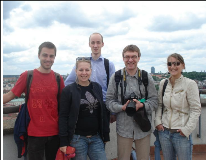
Gruppenfoto auf der alten Burg

Stadt zu erkunden. Wenn das Essen eines Landes tatsächlich die Seele seiner Bewohner widerspiegeln sollte, so ließe sich festhalten, dass die litauische sicherlich eine sehr mächtige wäre.