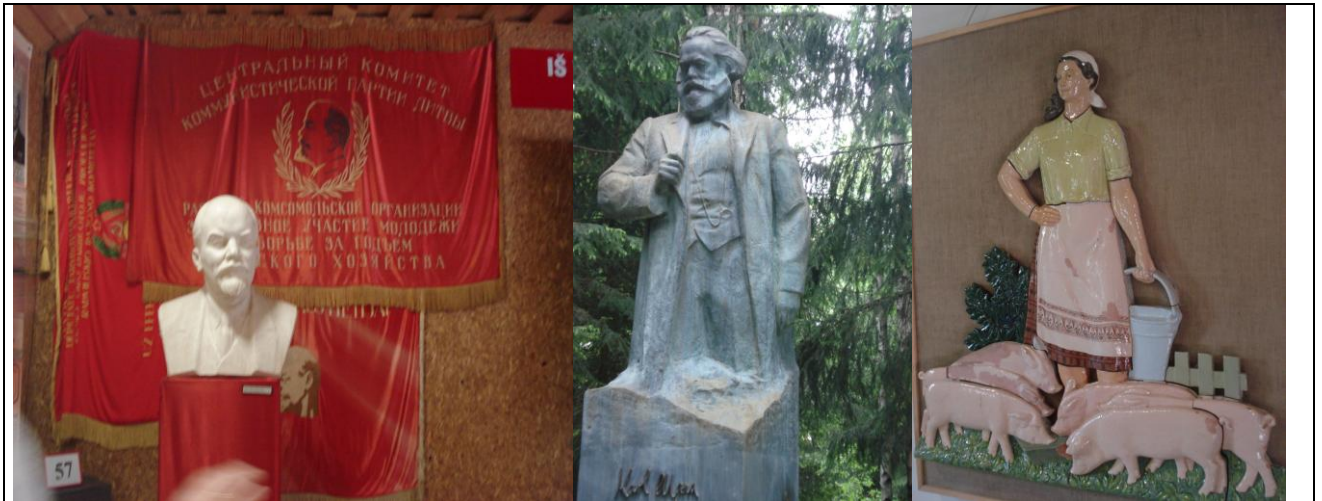
Im kommunistischen Themenpark: Lenin, Marx und die stilisierte Darstellung einer Bäuerin

hat ja sonst nicht so oft die Möglichkeit sich mit kommunistischer Kunst, Kultur und Propaganda auseinander zu setzen. Besonders spannend waren hier auch die Ausführungen unseres Professors, der uns eine kurze Einführung in die sowjetische Machtpolitik gab und geduldig auf alle unsere Fragen zu den Unterschieden zwischen Leninismus, Stalinismus, Trotzismus und Maoismus antwortete und zusätzlich noch die verschiedenen politischen Flügelkämpfe und deren Auswirkungen auf die Bevölkerung erläuterte. Auch die Instrumentalisierung von Kunst für Propaganda konnten wir uns vor Ort ansehen, wengleich wir zunächst Probleme hatten ein Landschaftsbild als politisches Instrumentarium zu sehen.