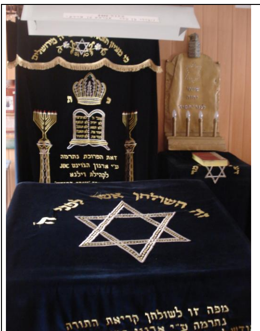
Führung in der jüdischen Synagoge

Der letzte Tag führte uns noch zur letzten erhaltenen jüdischen Synagoge in Vilnius. Vor dem Einmarsch der Nazis und deren Terrorherrschaft, waren es einst mehr als 100. Uns wurde dort sehr viel über die jüdische Tradition und Kultur erklärt und wir wurden sehr freundlich empfangen. Nach der Besichtigung noch einer Kirche, hier machten einige Kursteilnehmer leider schlapp, ging es dann zum Flughafen und schließlich zurück nach Regensburg. Was geblieben ist? Es hat wohl jeder etwas anderes von dieser doch sehr exklusiven Exkursion mitgenommen. Jeder hat sich für andere Gebiete interessiert. Die einen fanden die alten Burgen und die Geschichte am faszinierendsten, andere die belarussischen Studenten/ innen, den europäischen Integrationsprozess oder den kommunistischen Themenpark. Mitgenommen haben wir aber alle eines: Eigentlich schenken wir einer Region, die so bedeutend und so geschichtsträchtig ist, viel