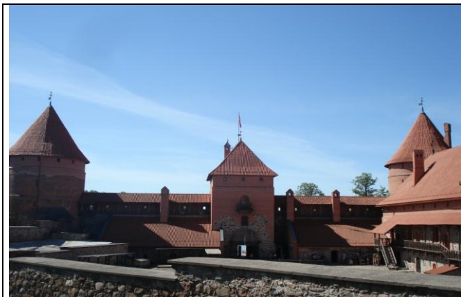
Die romantische, idyllische Burg in Trakai

Der Sonntag sollte uns erneut Land und Leuten näher bringen. Zunächst besichtigten wir die Burg in Trakai, welche schon fast so idyllisch war, dass sie wie aus einem Märchenpark schien. Schwierig war dabei bloß, dass die Rekonstruktion der Burg wohl eher den ästhetischen Geschmack der zum Romantizismus neigenden Besucher befriedigen sollte, als historischen Fakten zu genügen.