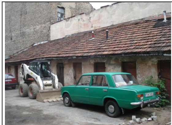
Litauische Hinterhöfe im Wandel der Zeit