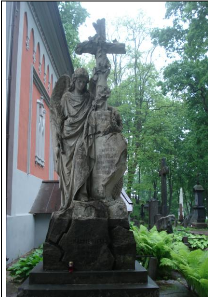
Der Rossafriedhof in Vilnius

ging es wieder zurück nach Wilna – Eindrücke die geblieben sind: Hochzeitskleider – Mickiewicz's Affären (polnisch-litauischer Nationaldichter) – ein singender Mönch. Ach ja und die Fahrt nach Hause: