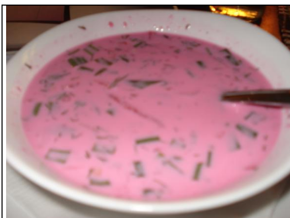
Traditionelles litauisches Essen: kalte „Rote-Bete-Suppe“

Der dritte Tag unseres Besuches sollte sich in zwei größere Abschnitte gliedern. Zunächst erkundeten wir das alte jüdische Viertel in Vilnius und erinnerten uns dabei der Gräueltaten und Verbrechen die während des Zweiten Weltkrieges begangen wurden. Nach einer Verarbeitungspause