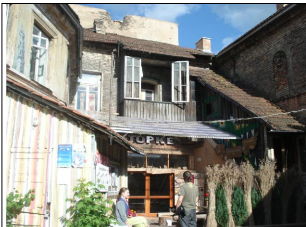
Eine eigene Welt: Künstlerkolonie in Vilnius

erscheinen. Auf den Spuren der Freiheit wanderten wir auch in eine autonome Künstlerkolonie, die sich zum eigenständigen Staat erklärt hat und sich trotz Ansiedelung in bester Baulage bisher erfolgreich gegen den Einfluss der Immobilienbranche verteidigt hat.