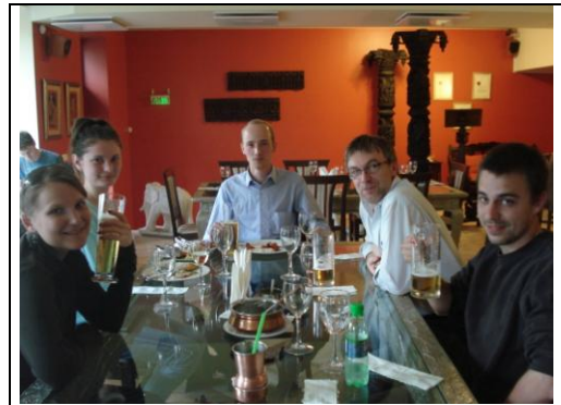
Unser Abschlussabendessen mit Begleitung einer der Studentinnen der belarussischen Universität