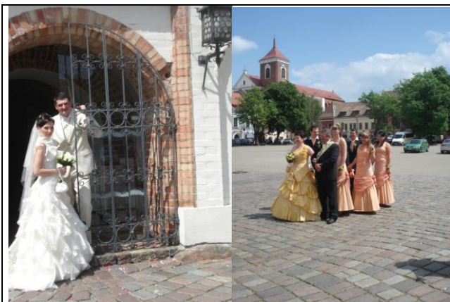
Hochzeitspaare und Brautjungfern vor dem Standesamt

„Wieder Regen! Aber eine tolle Stimmung für einen Friedhofsbesuch. Kein so ein geschneigelter Friedhof. Nein! Ein alter mit verfallenen Grabsteinen und viel Grün. Da ist die letzte Ruhestätte einiger großer Litauer-Polen (...wie auch immer, man kann sich das ja aussuchen wie man das grad braucht). Und wir lernten etwas über Adler und das Leben auf Felsen und dass man auch mal was wagen muss. Weiter ging's durch Litauen – sehr schönes Land – nach Kaunas – sehr schöne Stadt. Einige Referate und Kirchen später