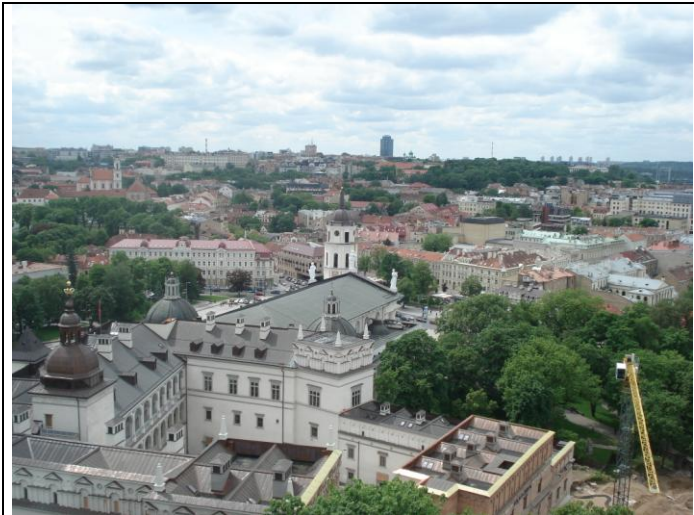
Blick über die Vilniuser Altstadt und das Schloss