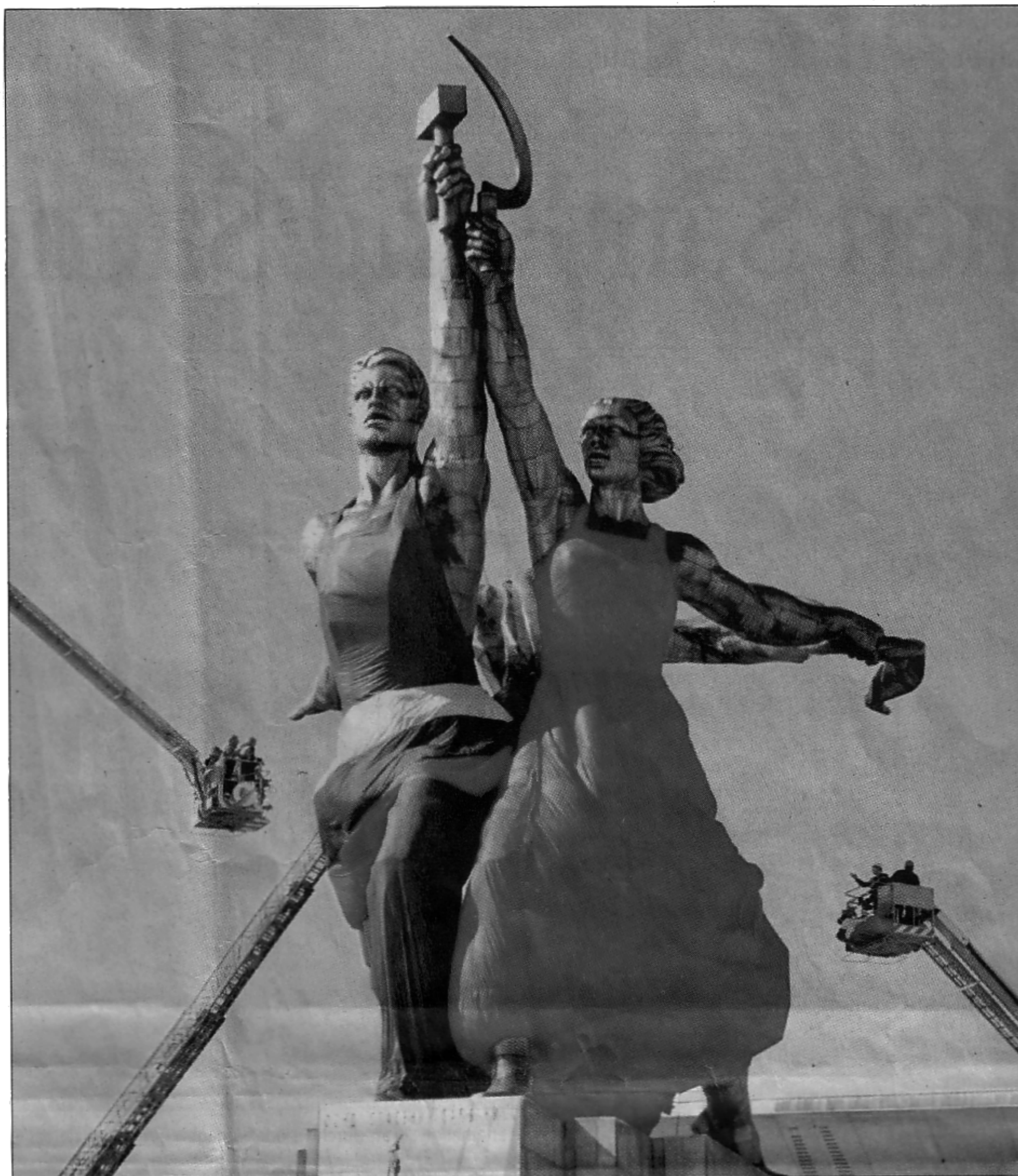
Das Muchina-Monument in Moskau: Der Sowjetmensch wurde in der kommunistischen Gesellschaft als Vorbild gepredigt. Ein Mensch, der auf den Staat fixiert und unfähig ist, das eigene Schicksal in die Hände zu nehmen.

Die Ostdeutschen mussten den westlichen Wohlstand als etwas Selbstverständliches annehmen. Daraus ergeben sich jedoch gravierende sozialpsychologische Folgen. Wenn sie mit einem durchschnittlichen Ostdeutschen reden, dann versteht er im Gegensatz zu einem durchschnittlichen Letten und Esten, Ukrainer oder Ungarn nicht,