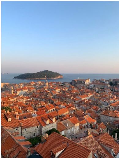
Blick auf Lokrum und die Altstadt