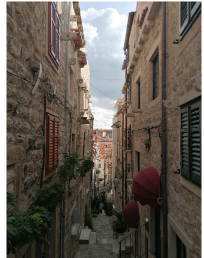
Kleine Gasse in Dubrovnik