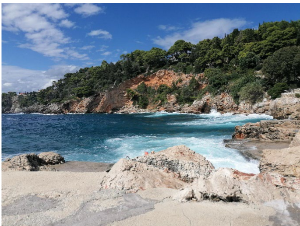
Badestelle nahe der Unterkunft